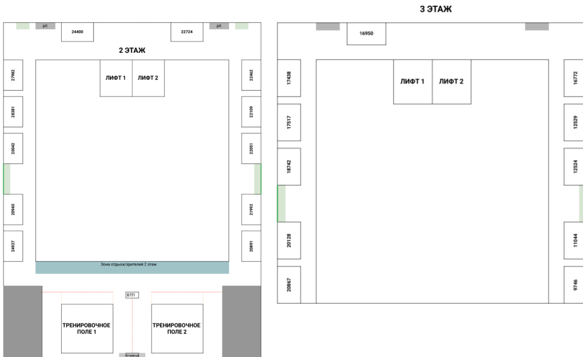
Рис. 3. Пример плана технических зон с размещением зон на нескольких этажах.